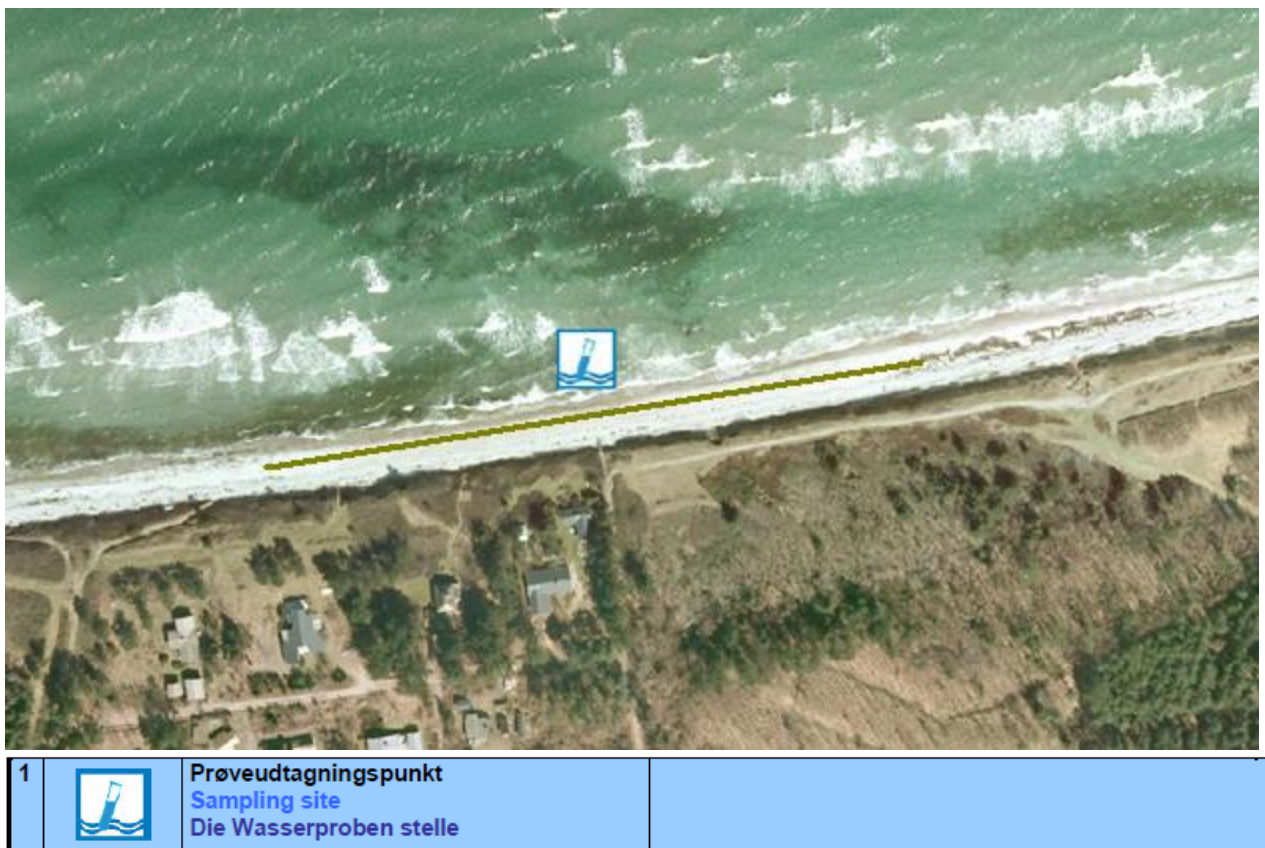
Fig. 1. Oversigtskort over Sonnerup skov strand, med information om diverse faciliteter.

Badestedet er beliggende ud mod Kattegat, nord for Lumsås. Her findes en sandstrand med nogen sten. Strandens udstrækning fremgår af kortet nedenfor (Fig. 1). Stranden er ca. 250 meter lang og består af et område af sand/sten der er ca. 13 meter bredt. Der er, ved prøvetagningsstedet, ca. 14 m ud til ½ meters dybde og 100 meter til 2 meters dybde (aflæst på søkort).