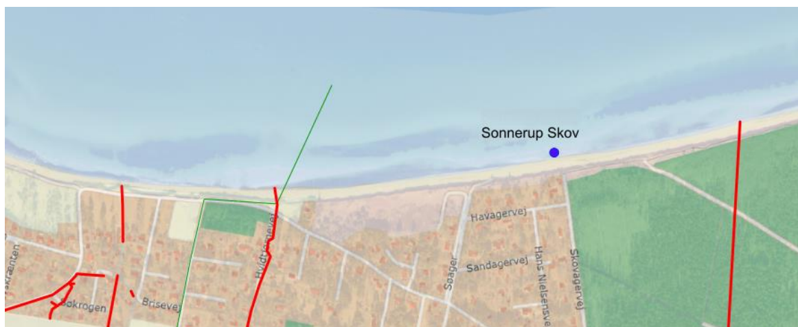
Fig. 3. Oversigtskort over de registrerede udløb i nærheden af badestedet. Rød farve er dræn. Grøn farve er udløb fra fællessystem 250 m ud i havet.

Der var en fækal forurening i slutningen af august 2019, men ellers har stranden sædvanligvis fint badevand. Et kraftigt regnvejr forud for prøvetagningen i 2019 formodes at have forårsaget overskridelsen. En evt. fækal forurenings varighed vil afhænge af omfanget af forureningen og af strøm- og vejrforhold. Ved lave koncentrationer vil varigheden i sommerperioden normalt være kort (1-3 dage, afhængig af vejr, strøm og vind).