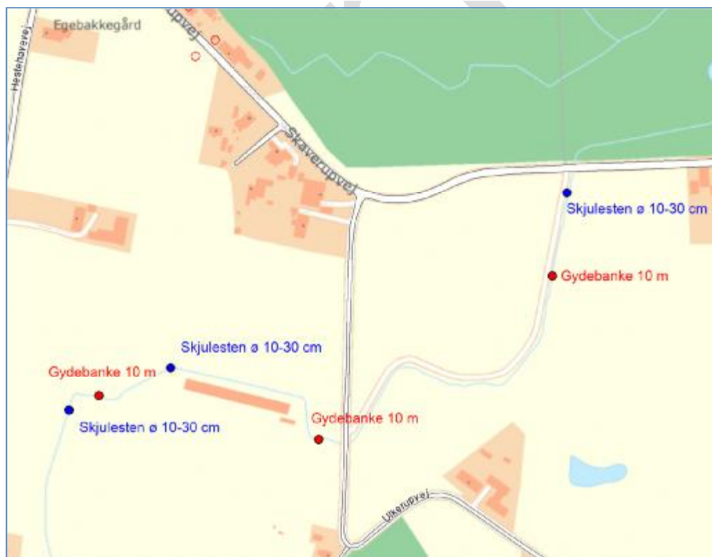
Oversigtskort 2. Kort over placering af gydebanke og skjulesten ved Ulkerupvej. 1:2.500