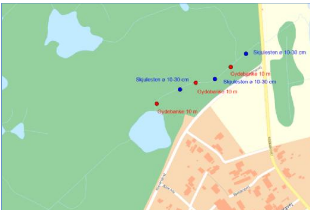
Oversigtskort 4. Kort over placering af gydebaner og skjulesten i skoven neden for søen. 1:2.500