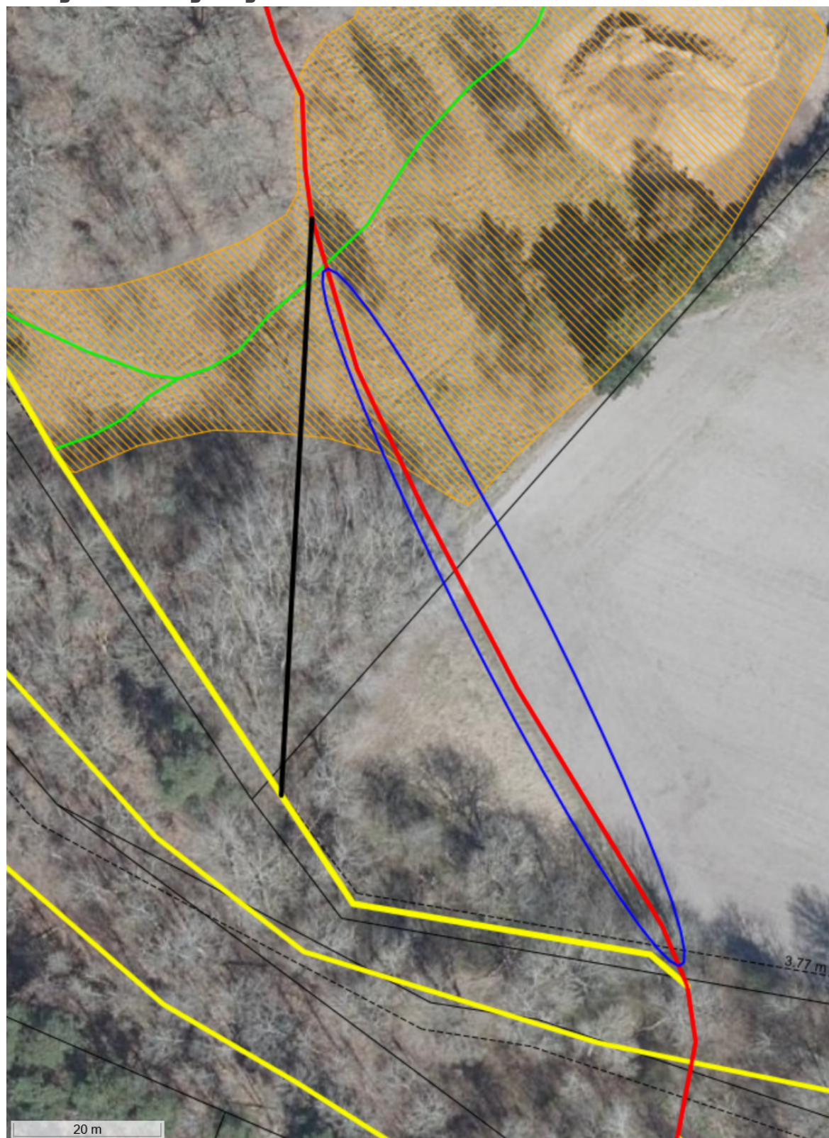
Figur 3. Luftfoto fra 2025 med tyk sort streg som angiver nyt stredlæg og blå ellipse som angiver del af gennemgående sti som nedlægges.