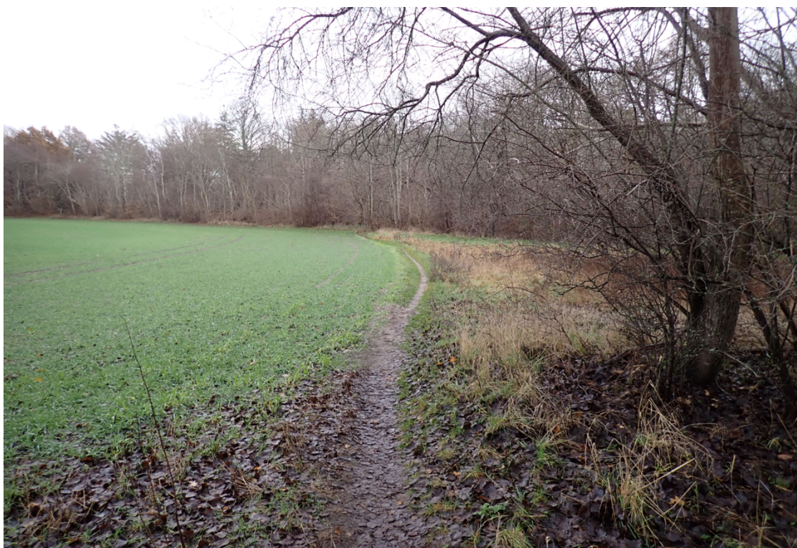
Figur 6. Stien over marken på den strækning som ønskes omlagt.