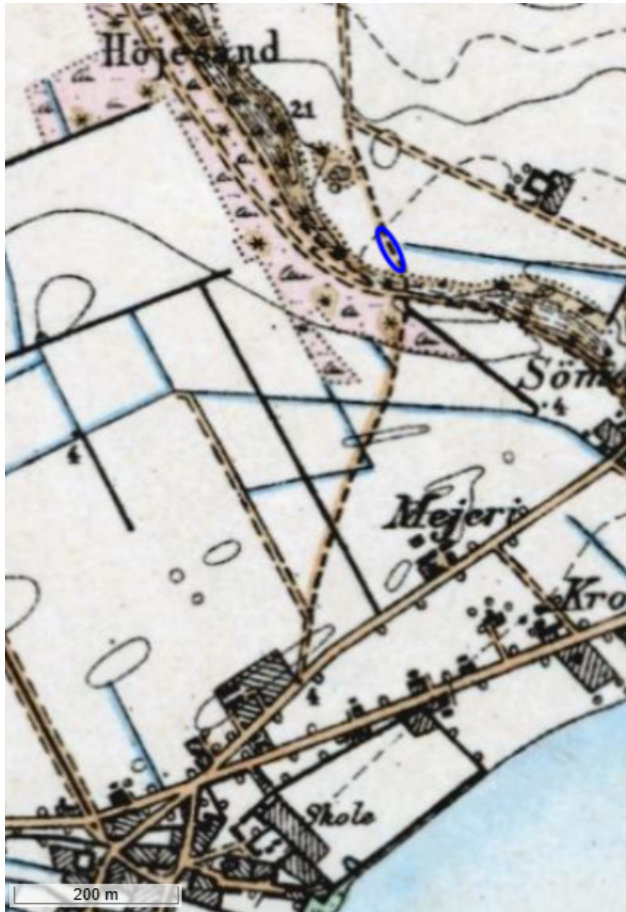
Figur 1. Gamle målebordsblade 1842-1899. Stistrækningen som du ønsker at nedlægge, er markeret med blå ellipse.

Højsandet som stien går på tværs af er en langstrakt indlandsklit med skovbevoksning som er ejet af Naturstyrelsen. I det område hvor stien krydser Højsandet er der en kløft i Højsandet som medfører at stien går igennem Højsandet uden at skulle over et væsentligt højdedrag.