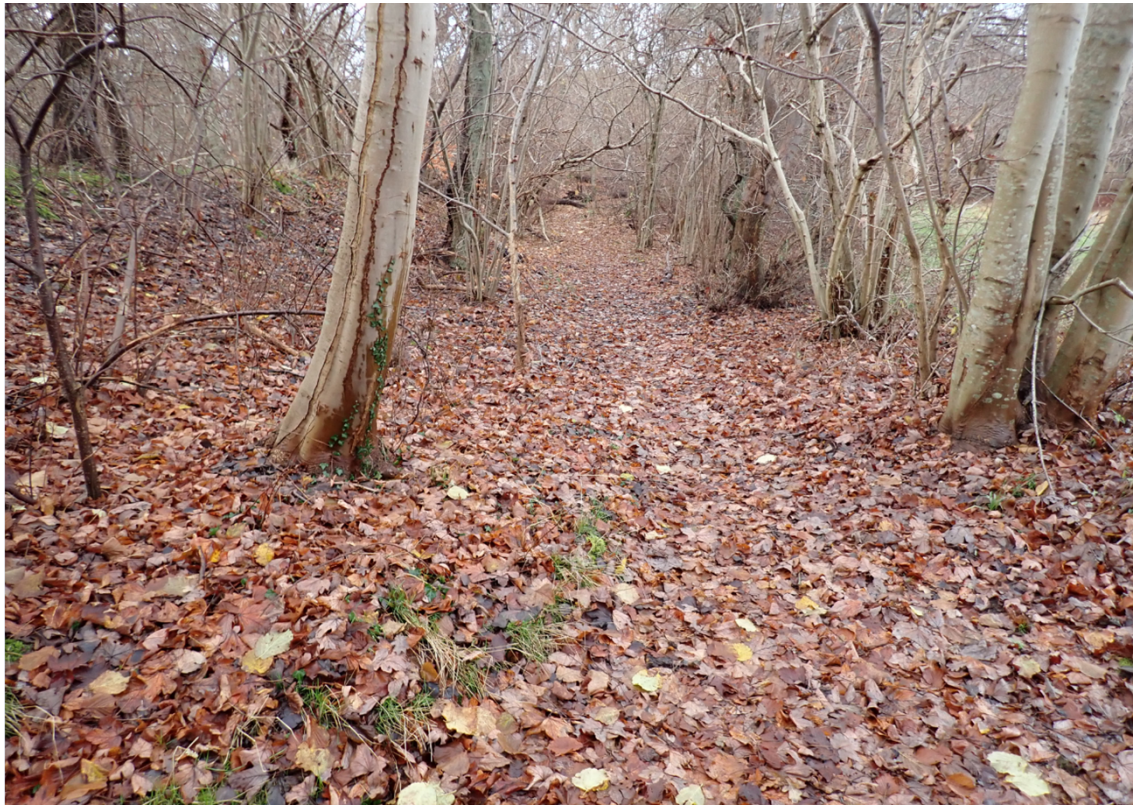
Figur 7. Alternativ stiforbindelse ved foden af Højsandet.