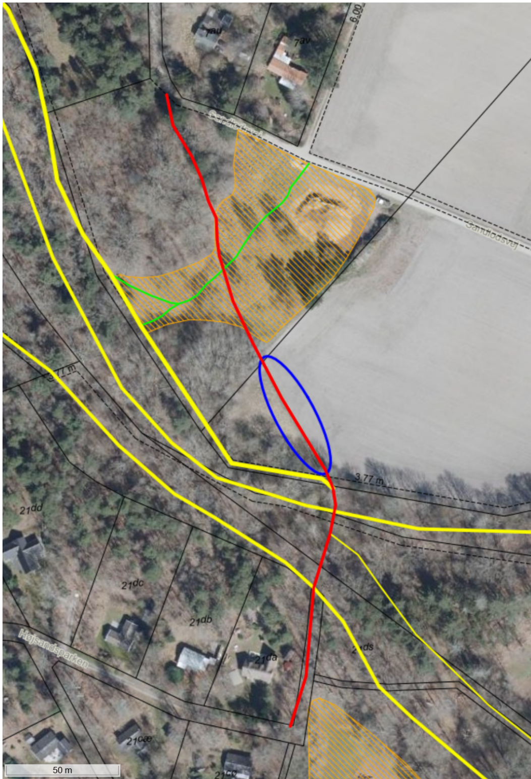
Figur 2. Luftfoto fra 2025, hvor den strækning af stien som du ønsker at nedlægge, er markeret af en blå ellipse. Rød markeret sti er gennemgående trampesti mellem sandlodsvej og Højsandsparken. Gult markerede stier er de væsentligste trampestier på Højsandet. Grønt markerede stier er trampestier på overdrevet.