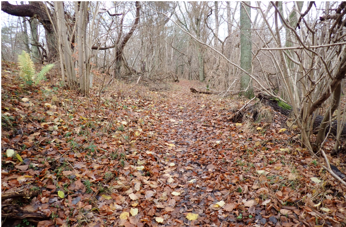
Figur 8. Alternativ stiforbindelse ved foden af Højsandet, tæt på det sted hvor stien skal forbindes med ny stiforbindelse.