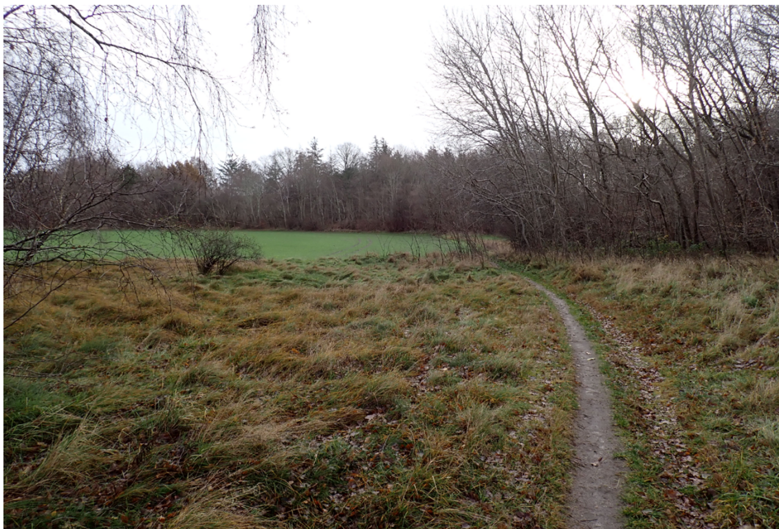
Figur 5. Stien over overdrevet på den strækning der ønskes omlagt.