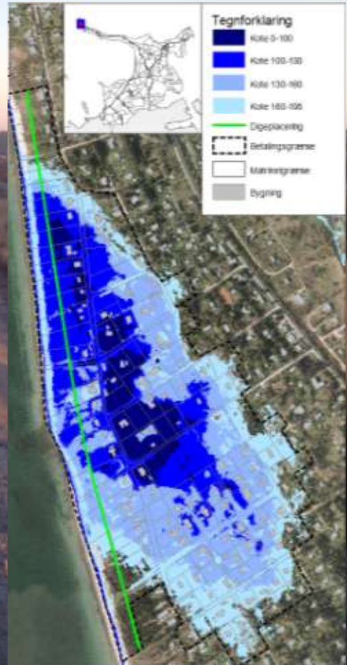
Udgiftsfordelingsoversigt årlig ydelse og andel af etableringslån