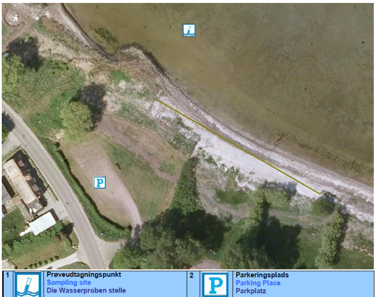
Fig. 1. Oversigtskort over Strandhuse strand, med information om diverse faciliteter.

Badestedet er beliggende ud til Isefjord i området ved Strandhuse. Her findes en sandstrand. Strandens udstrækning fremgår af kortet nedenfor (Fig. 1). Stranden er ca. 70 meter lang og består af et område af sand der er ca. 7 meter bredt. Der er, ved prøvetagningsstedet, ca. 24 m ud til ½ meters dybde, over 50 m til én meters dybde og 400 meter til 2 meters dybde (aflæst på søkort).