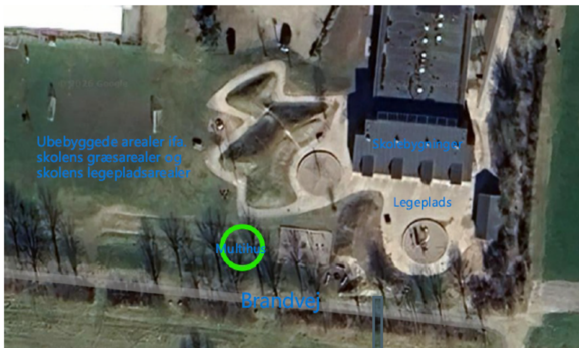
Figur 1 Situationsplan med placering af multihus (grøn cirkel)

Ejendommen ligger ikke i et lokalplanlagt område.