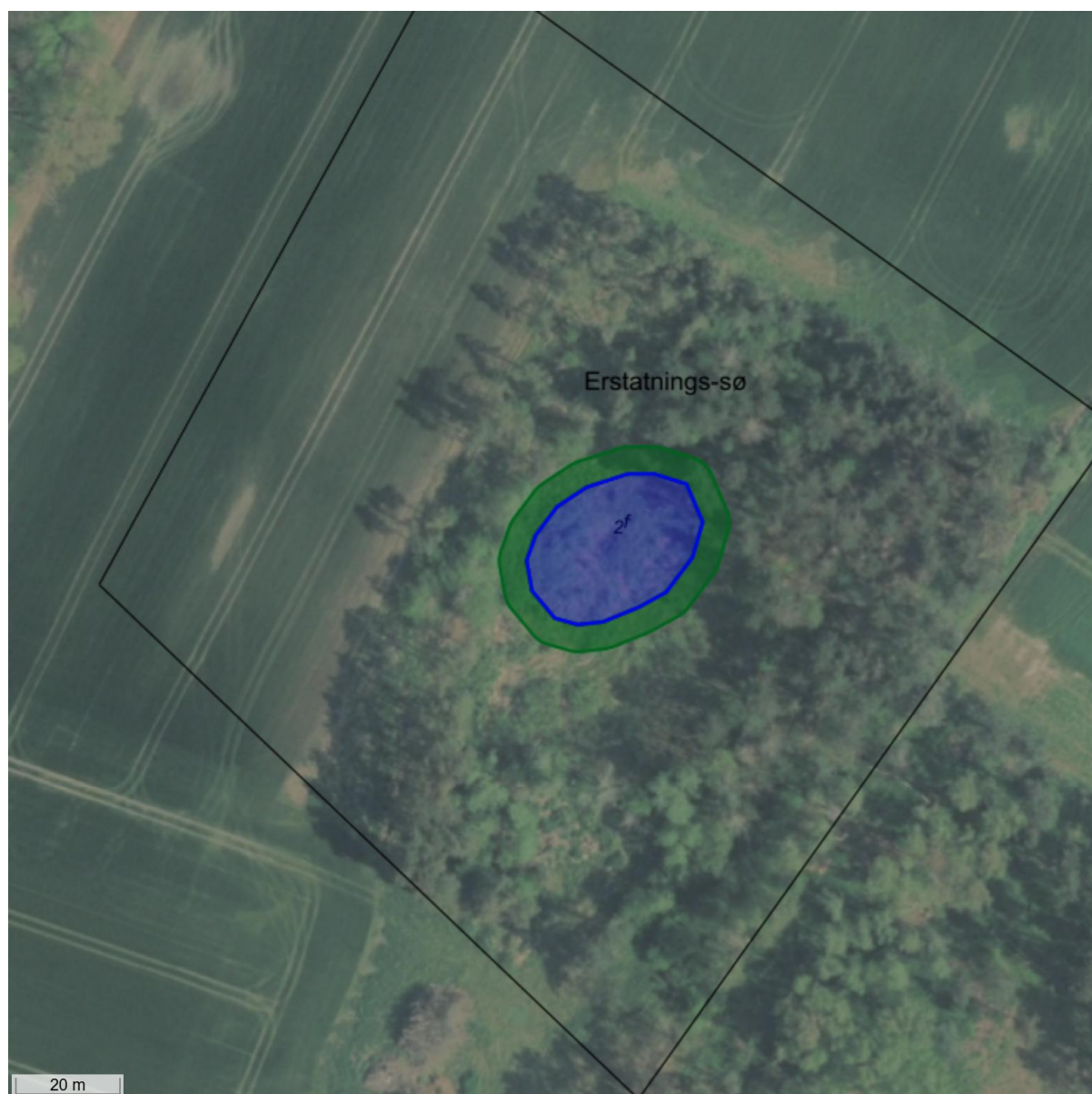
Figur 2. Luftfoto fra 2024 med blå markering af vandspejl i erstatnings-sø og grøn markering af brinker på erstatnings-sø.