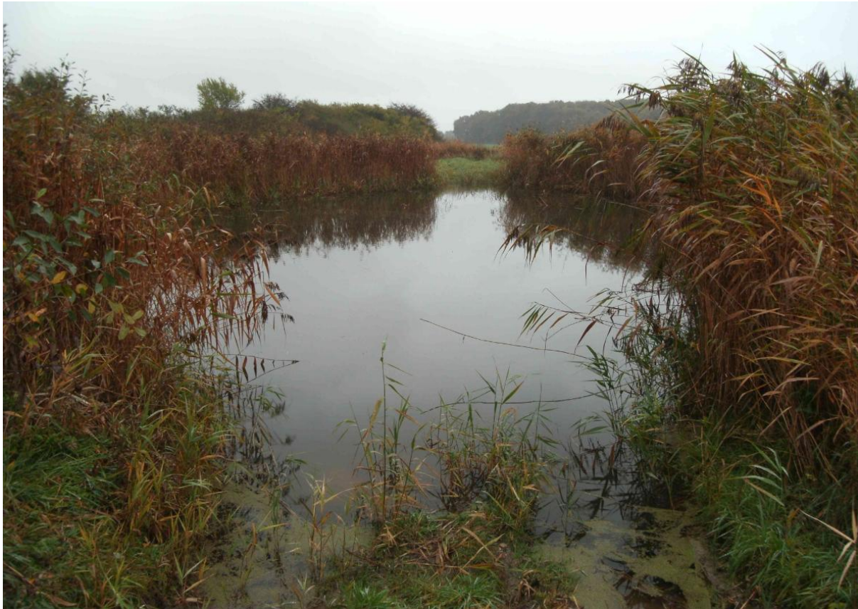
Figur 5. Foto af søen fra Aglajas besigtigelse den 21. oktober 2013.

Søen er opmålt på luftfoto til at have haft et areal inkl. bredzone på ca. 439 m 2 og et vandspejl på ca. 363 m 2 .