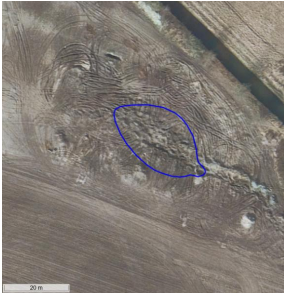
Figur 14. Flyfoto fra forår 2021.

På baggrund af søens opmålte størrelse, besigtigelserne af søen og udseende på flyfoto i den 28 års periode, hvor der ses en sø på flyfoto, er det kommunens vurdering, at søen var omfattet af naturbeskyttelseslovens § 3 på det tidspunkt, hvor søen blev fyldt op.