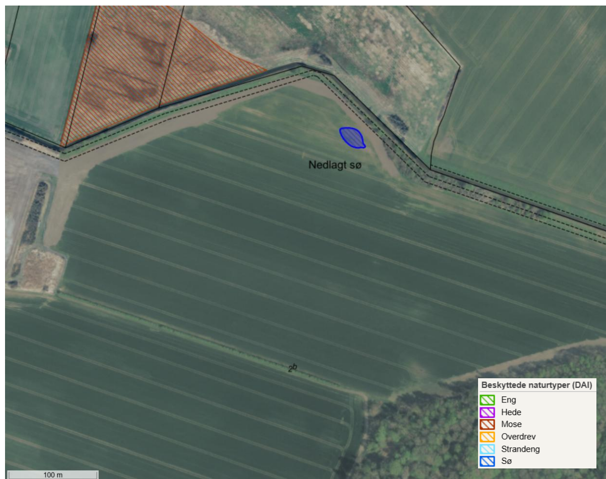
Figur 1. Luftfoto fra 2024 med blå markering af den nu nedlagte sø og skrånkravering af beskyttede naturtyper.