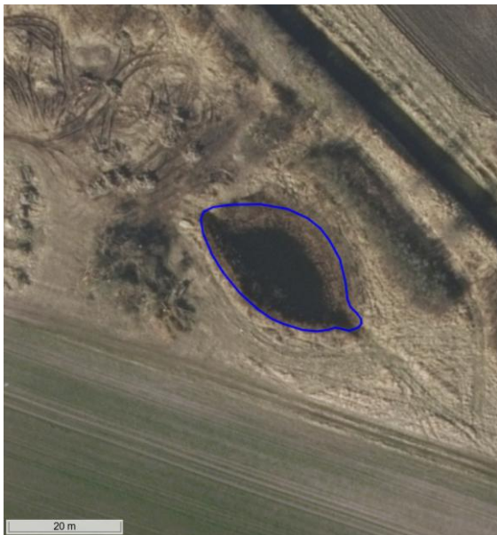
Figur 12. Flyfoto fra forår 2017