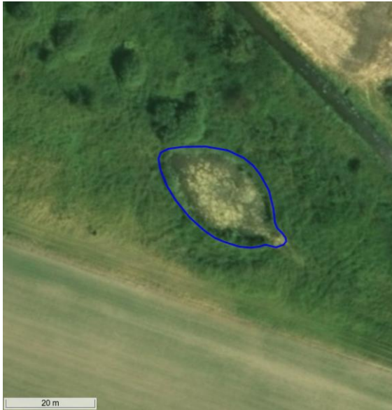
Figur 10. Flyfoto fra sommer 2008.