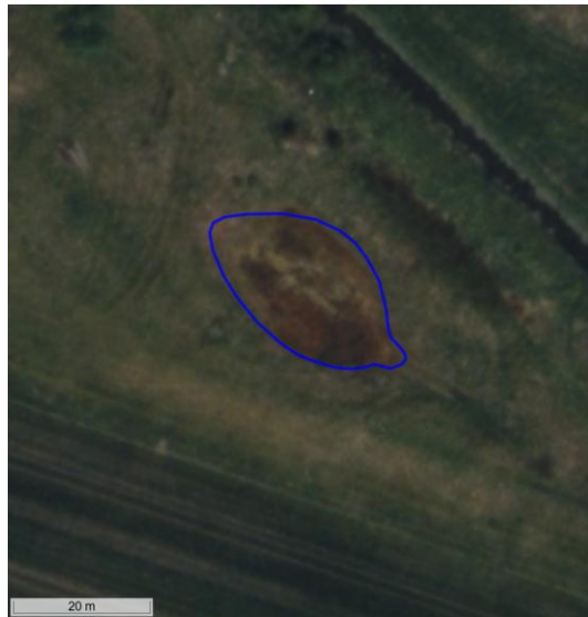
Figur 7. Flyfoto fra forår 1999