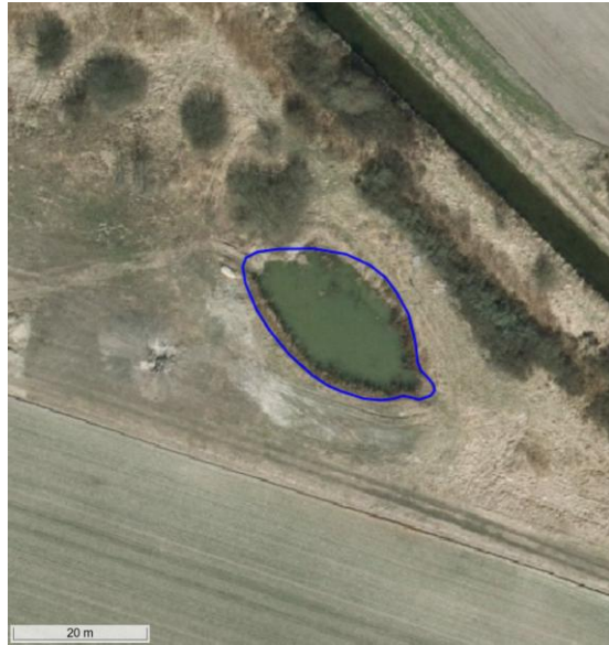
Figur 11. Flyfoto fra forår 2013.