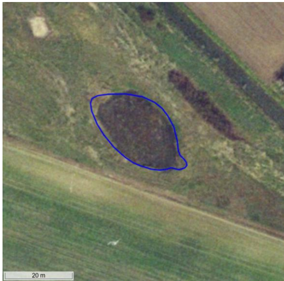
Figur 6. Flyfoto fra forår 1993