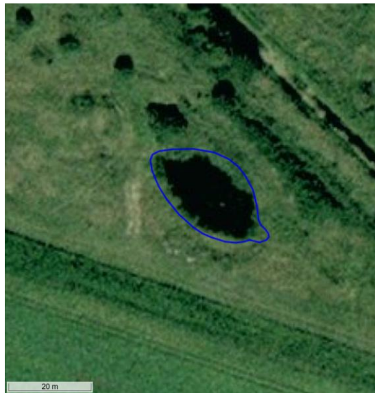
Figur 9. Flyfoto fra sommer 2005.