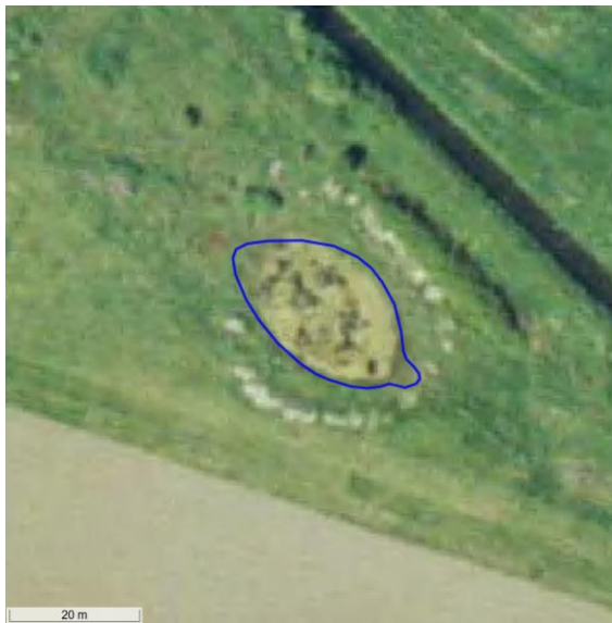
Figur 8. Flyfoto fra sommer 2002.