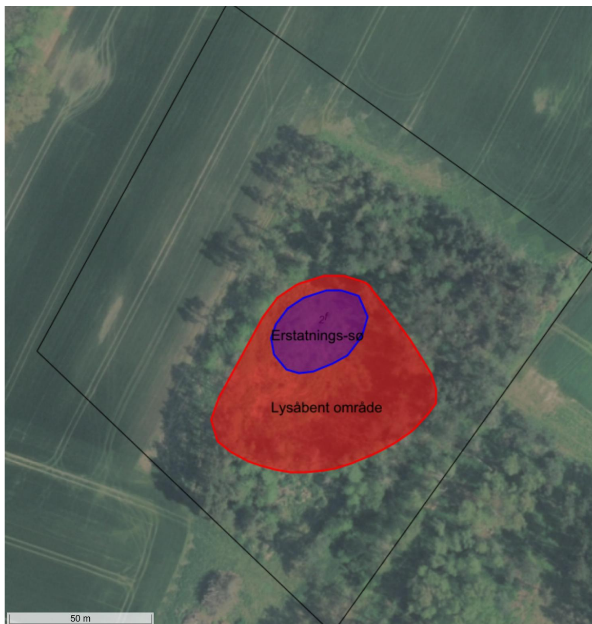
Figur 3. Luftfoto fra 2024 rød markering af område der skal holdes lysåbent. Erstatningssøen er markeret med blå.