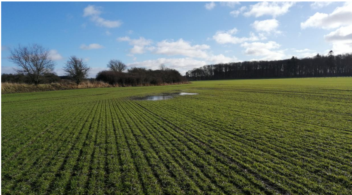
Figur 4. Foto fra besigtigelsen den 2. februar 2023. Der er en lille oversvømmelse på marken, der hvor søen har været.

Ved besigtigelsen kunne vi konstatere, at søen var nedlagt og at området var pløjet og inddraget i marken. Der hvor søen havde ligget, var der en lille oversvømmelse på marken, ellers var der ingen spor efter det tidligere naturområde på arealet.