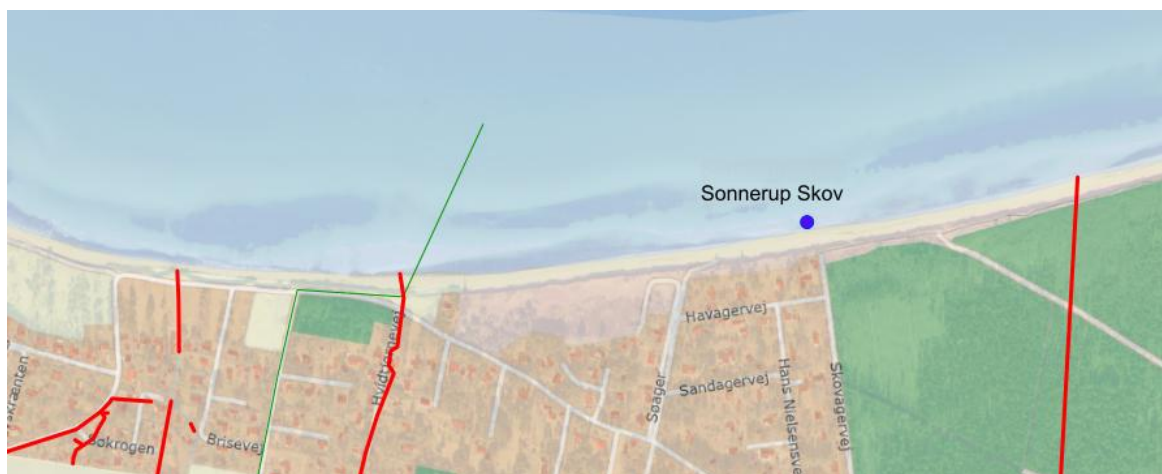
Fig. 3. Oversigtskort over de registrerede udløb i nærheden af badestedet. Rød farve er dræn. Grøn farve er udløb fra fællessystem 250 m ud i havet.

Der var en fækal forurening i slutningen af august 2019, men ellers har stranden sædvanligvis fint badevand. Et kraftigt regnvejr forud for prøvetagningen i 2019 formodes at have forårsaget overskridelsen. En evt. fækal forurenings varighed vil afhænge af omfanget af forureningen og af strøm- og vejrforhold. Ved lave koncentrationer vil varigheden i sommerperioden normalt være kort (1-3 dage, afhængig af vejr, strøm og vind).