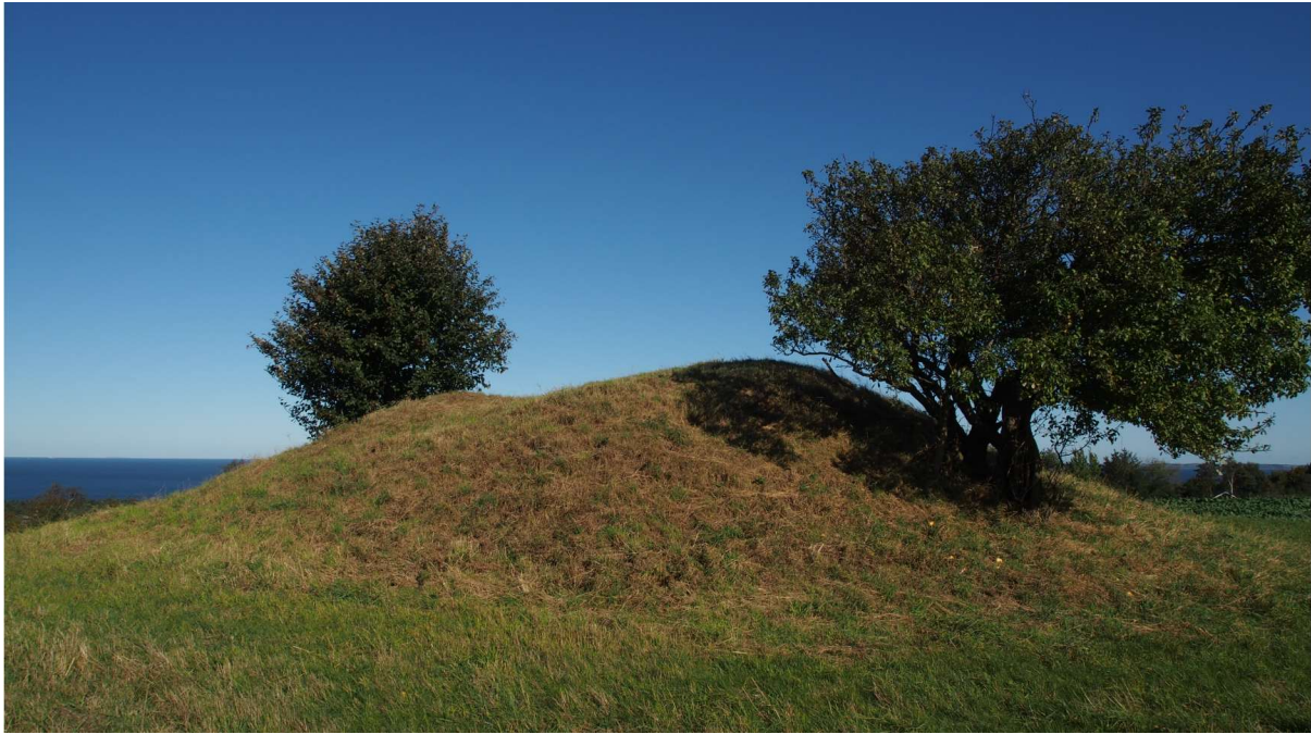
Foto af gravhøjen fra hjemmesiden " Fund&Fortidsminder ", set fra syd.

Formålet med fortidsmindebeskyttelseslinjen er at sikre fortidsmindernes værdi som landskabslementer. Både den generelle betydning af fortidsminderne i landskabsbilledet samt indsyn til og udsyn fra fortidsminderne. Samtidig skal linjen sikre de arkæologiske lag i området, idet der ofte er særlig mange kulturhistoriske levn i områderne tæt ved de fredede fortidsminder.