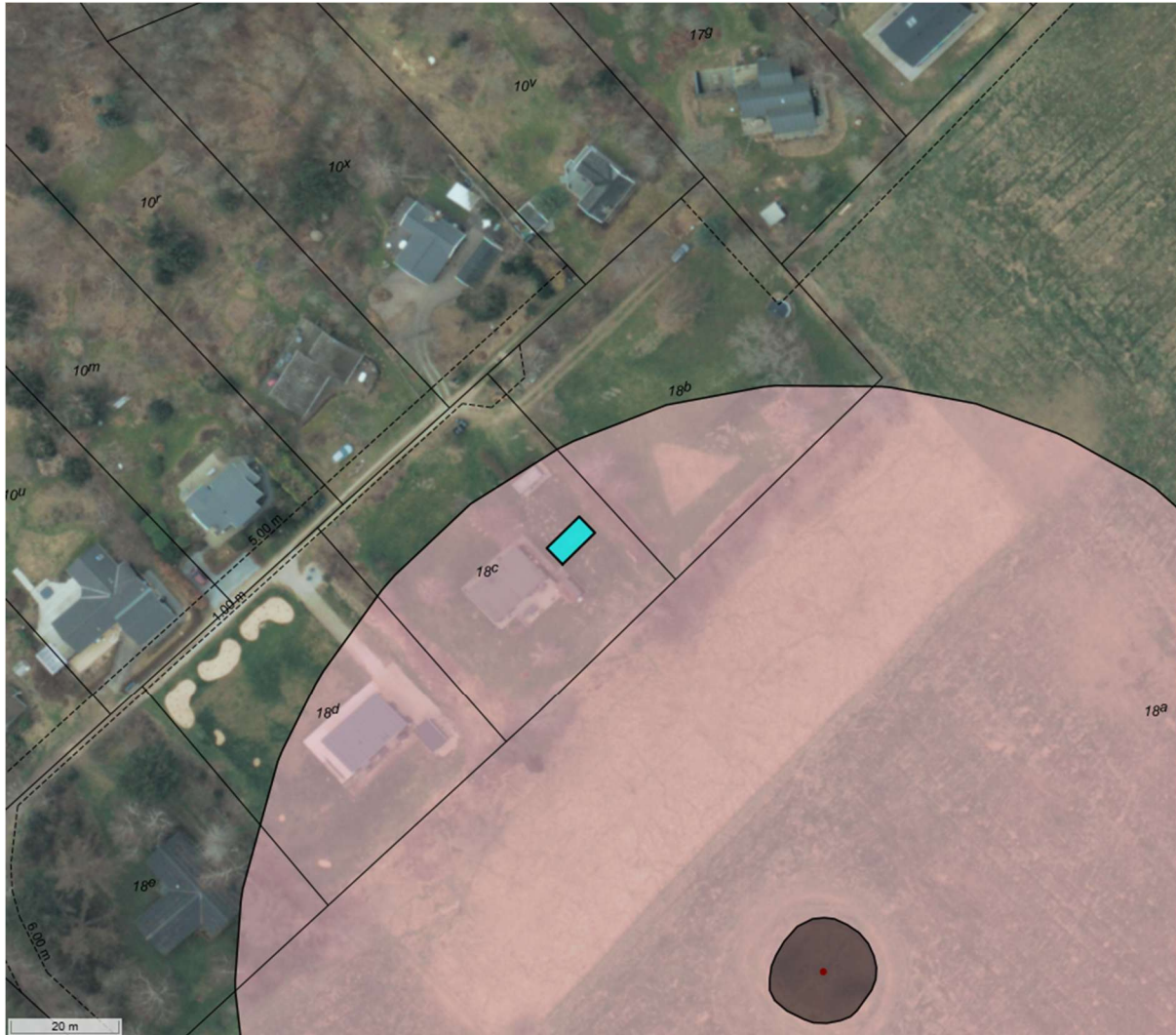
Luftfoto fra 2024 med turkis markering af det ansøgte anneks. Gravhøjen er vist med mørkegrå og fortidsmindebeskyttelseslinjen er vist med lyserød.