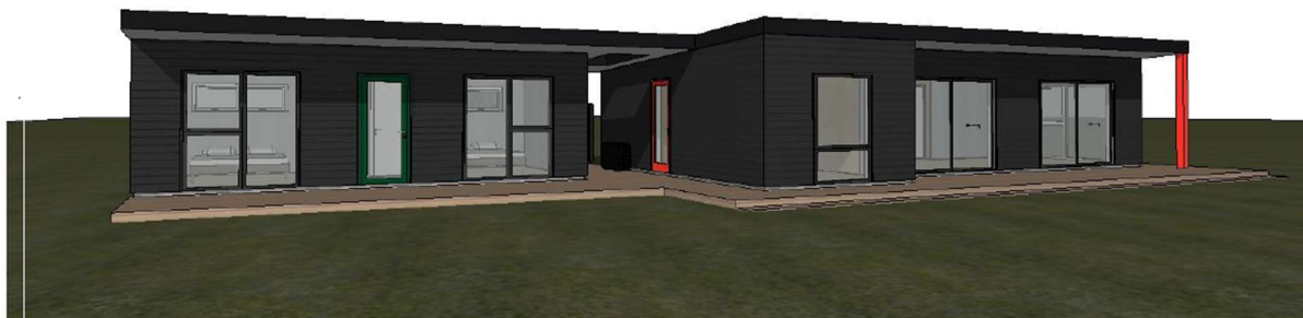
Illustration af annekset og eksisterende sommerhus fra ansøgningsmaterialet.

Annekset får vandret sortmalet træbeklædning som det eksisterende sommerhus. Taget udføres med tagpap som det eksisterende sommerhus. Døre og vinduer udføres i samme farve og materiale som i det eksisterende sommerhus.