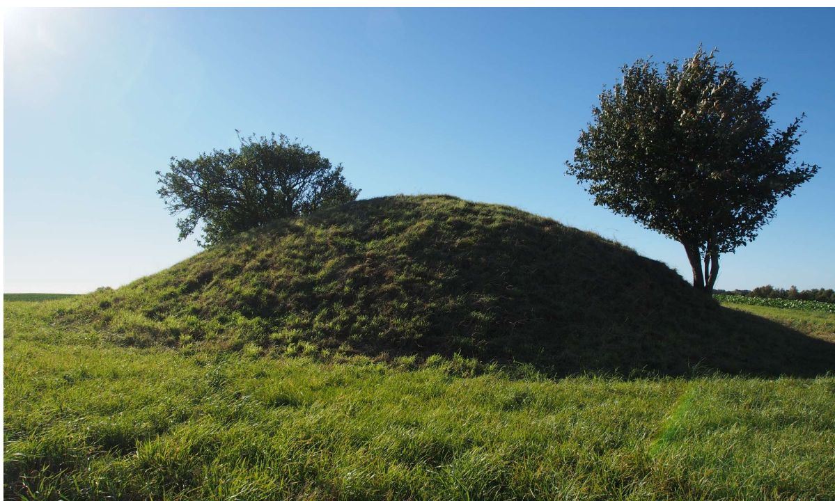
Foto af gravhøjen, set fra nord.

Fortidsmindet kaldet Manghøj har fredningsnummer 292219. Ifølge Slots- og Kulturstyrelsen hjemmeside " Fund&Fortidsminder " er det en 3 meter høj og 14 meter bred rundhøj fra oldtiden, som har en særdeles flot beliggenhed med storslået udsigt over Odden, Ordrup Næs og Lamme fjorden. Højen er bevokset med græs. I kan læse mere på https://www.kulturarv.dk/fundogfortidsminder/Lokalitet/103888/ .