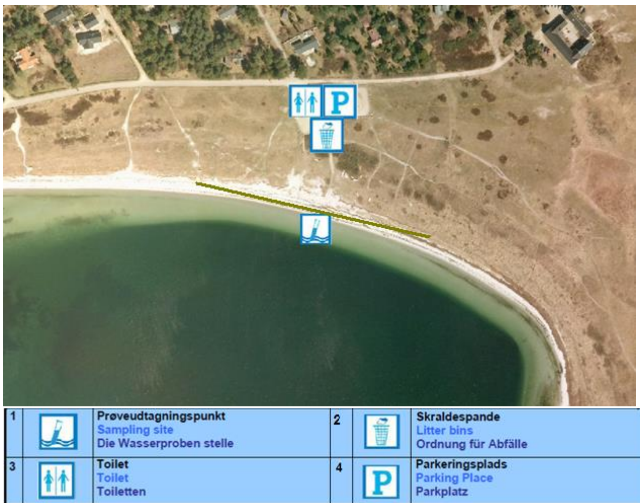
Fig. 1. Oversigtskort over Skanse Tværvej strand, med information om diverse faciliteter.

Badestedet er beliggende ud mod Skansehagebugten i den østlige del af Rørvig. Her findes en fin sandstrand og strandens udstrækning fremgår af kortet nedenfor (Fig. 1). Stranden er ca. 200 meter lang og består af et område af sand der er ca. 10 meter bredt. Der er, ved prøvetagningsstedet, ca. 4 m ud til ½ meters dybde, 9 m til én meters dybde og 50 meter til 2 meters dybde (aflæst på søkort).