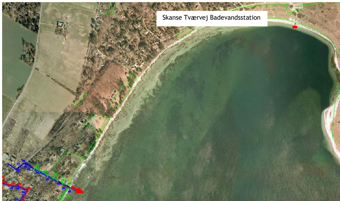
Fig. 3. Oversigtskort over de registrerede udløb i nærheden af badestedet. Ved rød pil udledes regnvand, spildevand, samt vand fra fællessystem, der udleder spildevand ved kraftig nedbør.