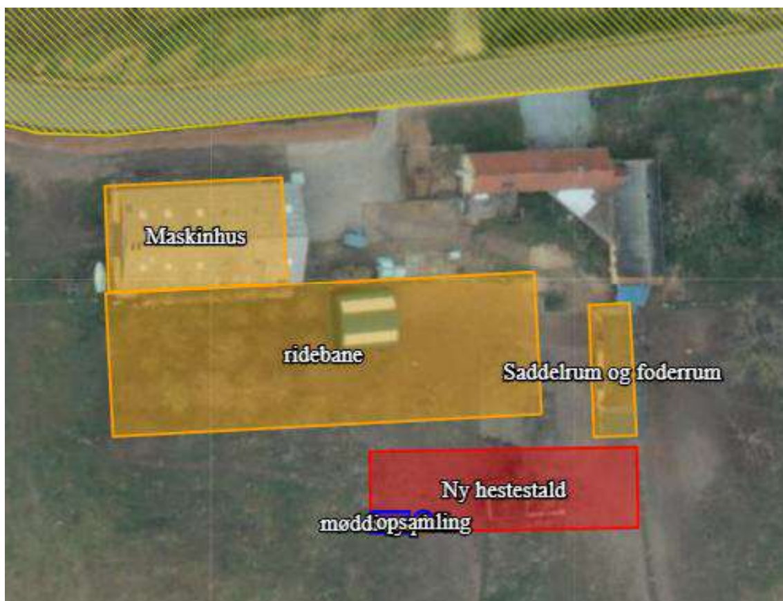
Figur 1. Husdyrbrugets eksisterende bygninger og ansøgte anlæg: staldanlæg (rød), gødningsopbevaringsanlæg (blå) og øvrige faciliteter: maskinhus, sadde- og foderrum og ridebane (gul).

Placering af ny hestestald, ny møddingsplads og opsamlingsbeholder, maskinhus samt ridebane fremgår af figur 1 herunder og situationsplanen i bilag 2.