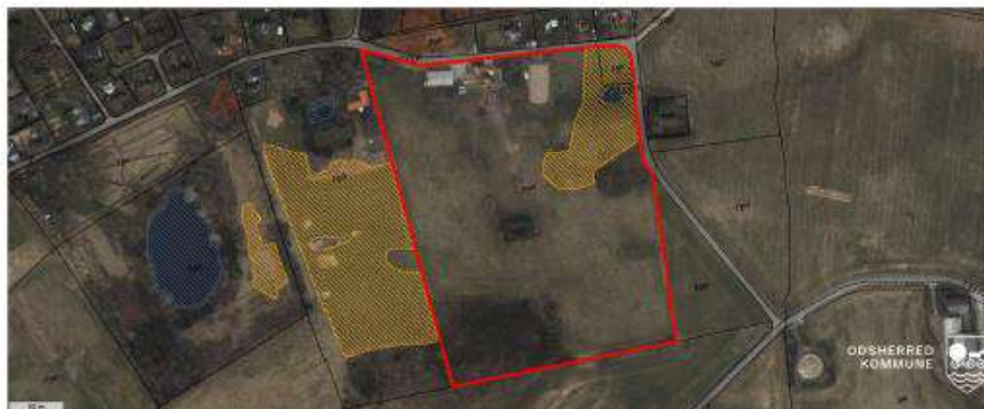
Luftfoto. Ejendommen er afgrænset af rød streg. Beskyttede naturtyper er vist med skraveret signatur.

Lidt syd for vandhullet på toppen af bakken findes en ældre krat- og træbevokset mergel- eller grusgrav. Samlet set har ejendommen en forholdsvis stor landskabelig variation. Den økologiske forbindelseslinje omfatter bl.a. dele af overdrevet, vandhullet, mergelgrav, levende hegn og skov.