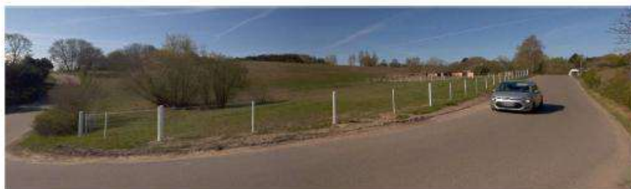
Udsyn over landskabet og ejendommen, hvor Klintebakken munder ud på Strandgårdsvej.

Nord og nordøstligt for ejendommen forløber Strandgårdsvej, hvorfra den primære offentlige indsigt til bakkelandskabet sker.