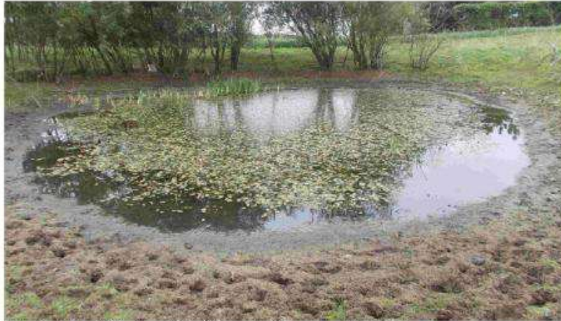
Foto fra §3 besigtigelse udført af konsulentfirmaet Aglaja i 2013.