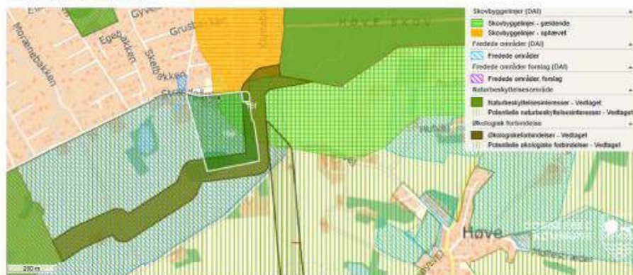
Kort 1: Ejendommen omkranset af hvid streg. Se signaturforklaring som indsat på kortet.

Ejendommen er beliggende i Veddinge Bakker, som er en central del af Vejrhøjbu, og den er omfattet af Grønt Danmarkskort dels som potentielt naturområde og en del af ejendommen som økologisk forbindelse.