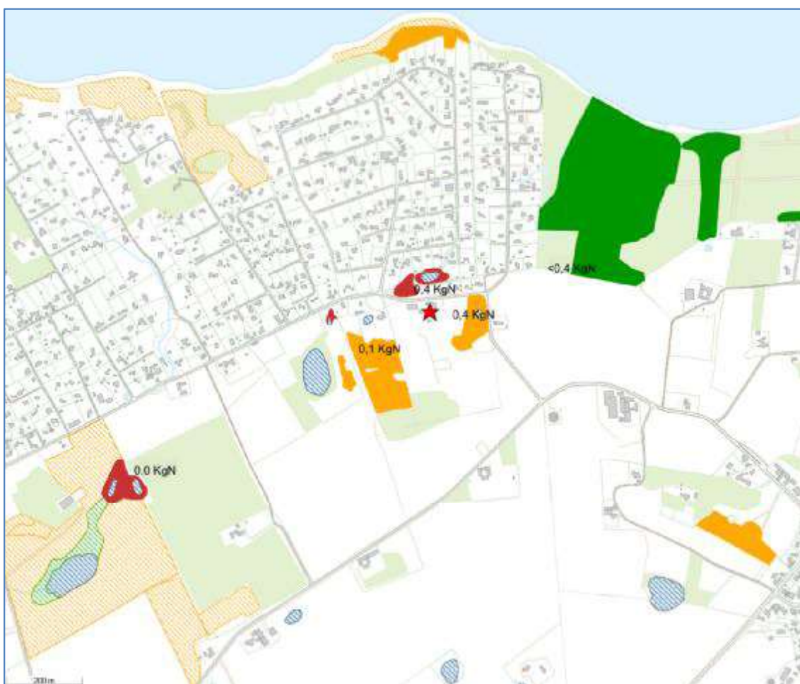
Figur 4. Kategori 3-natur og § 3-omfattet natur i øvrigt omkring anlægget. Anlæggets placering er markeret med en rød stjerne. Skov, moser, enge, overdrev og søer er angivet med hhv. mørkt grønt, rødbrunt, lyst grønt, lys orange og blå. Markering af kategori 3 natur er udfyldt og øvrig § 3 natur er skraveret. Depositionsberegninger er angivet ved nærmeste kategori 3-natur.

Figur 4 viser anlæggets beliggenhed i forhold til kategori 3-natur og øvrige naturområder omfattet af naturbeskyttelseslovens § 3.