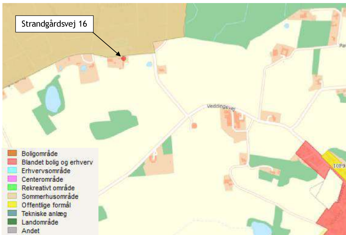
Figur 2. Husdyrbrugets placering i forhold til kommuneplanrammer og lokalplaner.

Husdyrbruget ligger i landzone i tæt på sommerhusområdet Veddinge Strand (rammeområde 11S1). Figur 2 viser husdyrbrugets placering i forhold til planrammerne i Odsherreds Kommuneplan 2021-2033.