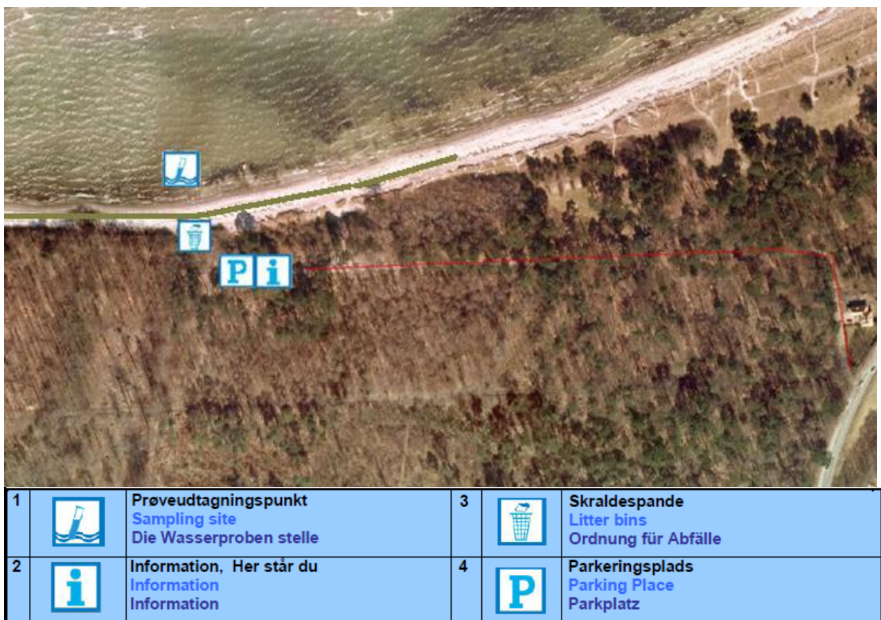
Fig. 1. Oversigtskort over Høve strand, med information om diverse faciliteter.

Badestedet er beliggende i den nordlige del af Asnæs. Her findes en fin sandstrand med spredte bæltter af store sten og strandens udstrækning fremgår af kortet nedenfor (Fig. 1). Stranden er ca. 700 meter lang og består af et område af sand/sten der er ca. 15 meter bredt. Der er, ved prøvetagningsstedet, ca. 14 m ud til ½ meters dybde, 27 m til én meters dybde og 375 meter til 2 meters dybde (aflæst på søkort).