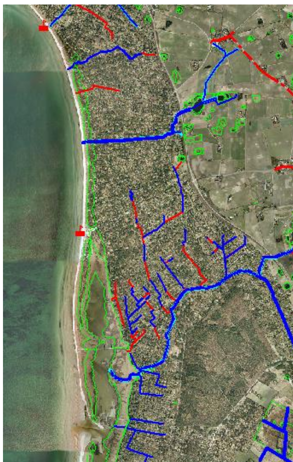
Fig. 3. Oversigtskort over de registrerede udløb i nærheden af badestedet