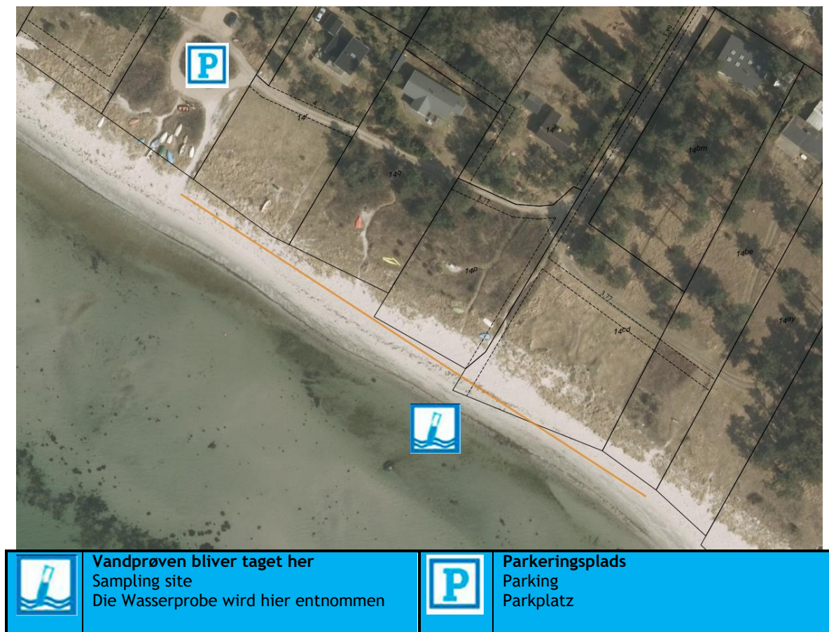
Fig. 1. Oversigtskort over Burvænget strand, med information om diverse faciliteter.

Badestedet er beliggende i Sejerøbugten vest for Lumsås. Her findes en fin sandstrand og strandens udstrækning fremgår af kortet nedenfor (Fig. 1). Stranden er ca. 200 meter lang og består af et område af sand der er ca. 11 meter bredt. Der er, ved prøvetagningsstedet, ca. 10 m ud til ½ meters dybde, 33 m til én meters dybde og 225 meter til 2 meters dybde ( aflæst på søkort).