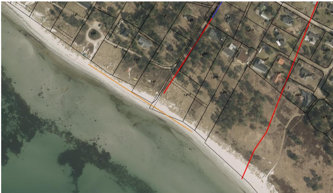
Fig. 3. Oversigtskort over de registrerede udløb i nærheden af badestedet