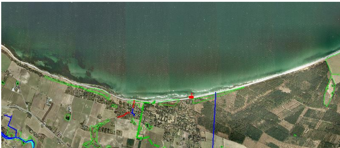
Fig. 3. Oversigtskort over de registrerede udløb i nærheden af badestedet

Der var en forurening i slutningen af august 2019. Stranden har sædvanligvis fint badevand. Et kraftigt regnvejr forud for prøvetagningen formodes at have forårsaget overskridelsen. En evt. forurenings varighed vil afhænge af omfanget af forureningen og af strøm- og vejrforhold. Ved lave koncentrationer vil varigheden i sommerperioden normalt være kort (1-3 dage, afhængig af vejr, strøm og vind).