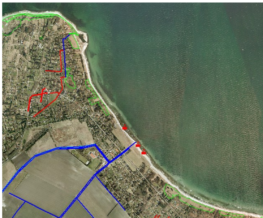
Fig. 3. Oversigtskort over de registrerede udløb i nærheden af badestedet

Klintsø strand har imidlertid ikke haft en eneste registreret overskridelse på fire år. En evt. forurenings varighed vil afhænge af omfanget af forureningen og af strøm- og vejrforhold. Ved lave koncentrationer vil varigheden i sommerperioden normalt være kort (1-3 dage, afhængig af vejr, strøm og vind).