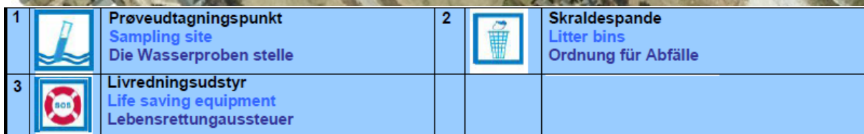
Fig. 1. Oversigtskort over Klintsø kanalstranden, med information om diverse faciliteter.