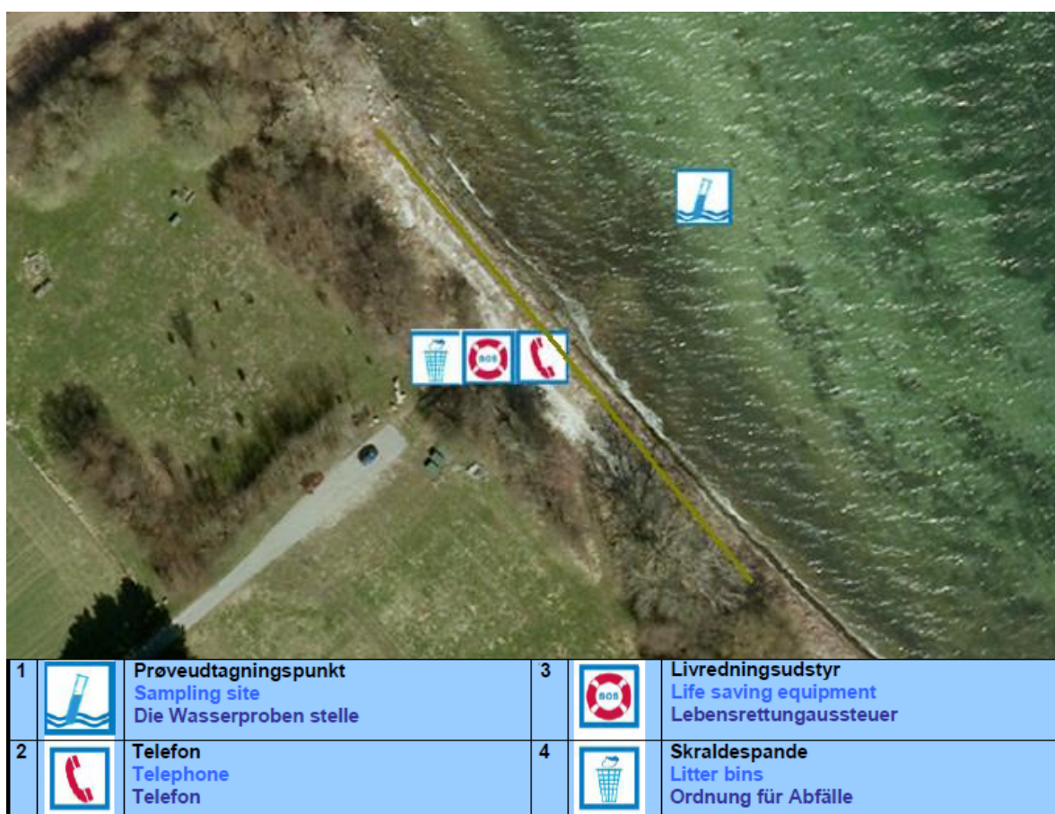
Fig. 1. Oversigtskort over Unnerød Huse strand, med information om diverse faciliteter.

Badestedet er beliggende ud til Isefjord, syd for Bøsserup, og øst for Unnerød. Her findes en sandstrand med nogen sten. Strandens udstrækning fremgår af kortet nedenfor (Fig. 1). Stranden er ca. 100 meter lang og består af et område af sand der er ca. 10 meter bredt og fortsætter ud i vandet. Der er, ved prøvetagningsstedet, for enden af broen, over 1 meters dybde, og fra land er der 100 meter til 2 meters dybde (aflæst på søkort).