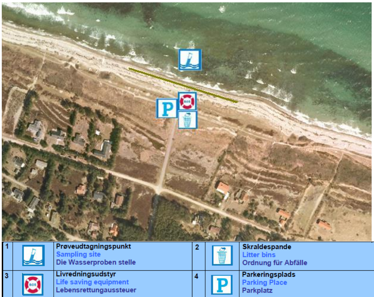
Fig. 1. Oversigtskort over Yderby lyng Strandvejen strand, med information om diverse faciliteter.

Badestedet er beliggende i den vestlige del af Sjællands Odde. Her findes en fin sandstrand og strandens udstrækning fremgår af kortet nedenfor (Fig. 1). Stranden er ca. 150 meter lang og består af et område af sand der er ca. 12 meter bredt. Der er, ved prøvetagningsstedet, ca. 10 m ud til ½ meters dybde og 40 meter til 2 meters dybde (aflæst på søkort).